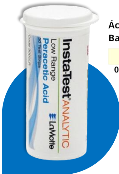
Ácido Peracético Rango Bajo ppm